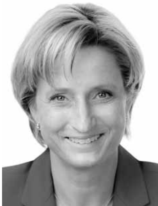
Dr. Hoffmeister-Kraut, Nicole CDU Ministerin für Wirtschaft, Arbeit und Tourismus *1972 Direktmandat WK 63 (Balingen)