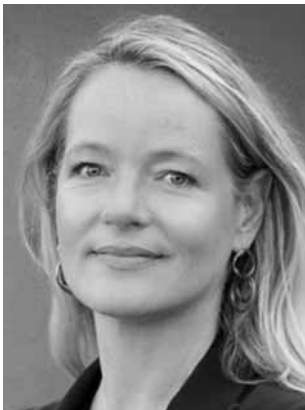
Walker, Thekla BÜNDNIS 90/DIE GRÜNEN Naturpädagogin, Ministerin für Umwelt, Klima und Energiewirtschaft; *1969 Direktmandat WK 5 (Böblingen)