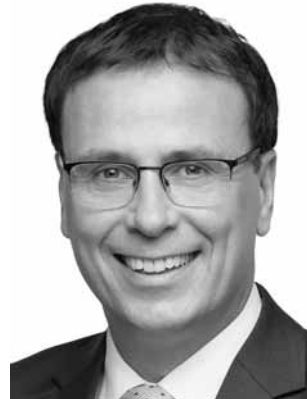
Schebesta, Volker CDU Staatssekretär *1971 Zweitmandat WK 51 (Offenburg)