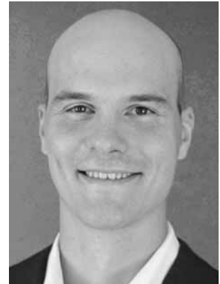
Seimer, Peter BÜNDNIS 90/DIE GRÜNEN Steueroberinspektor *1993 Direktmandat WK 6 (Leonberg)