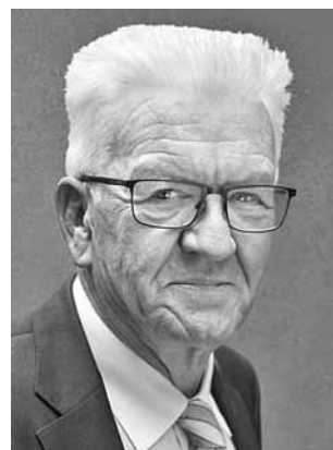
Kretschmann, Winfried BÜNDNIS 90/DIE GRÜNEN Ministerpräsident *1948 Direktmandat WK 9 (Nürtingen)