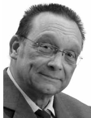
Eisenhut, Bernhard AfD Kaufmann *1958 Zweitmandat WK 57 (Singen)