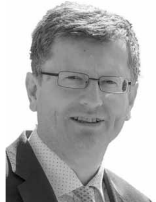
Klos, Rüdiger AfD Landtagsabgeordneter *1960 Zweitmandat WK 55 (Tuttlingen-Donaueschingen)