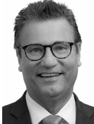
Hauk, Peter CDU Minister für Ernährung, Ländlichen Raum und Verbraucherschutz *1960 Direktmandat WK 38 (Neckar-Odenwald)