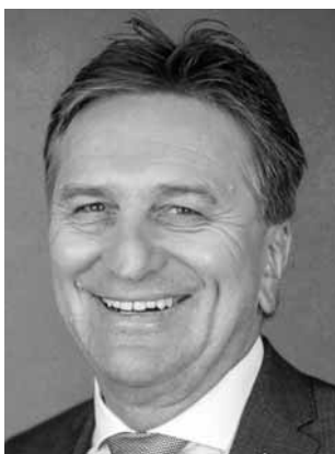
Lucha, Manfred BÜNDNIS 90/DIE GRÜNEN Minister für Soziales, Gesundheit und Integration; *1961 Direktmandat WK 69 (Ravensburg)