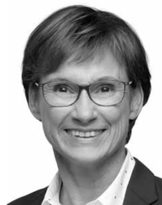
Kurtz, Sabine CDU Staatssekretärin *1961 Zweitmandat WK 6 (Leonberg)